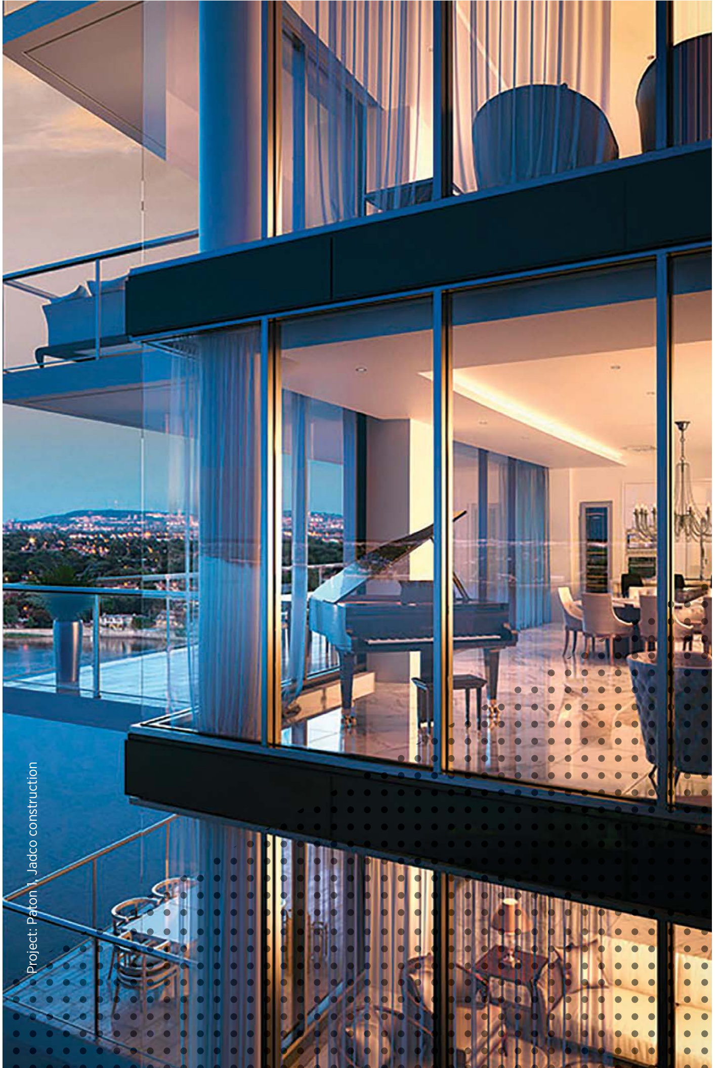
Project: Paton 1, Jadco construction